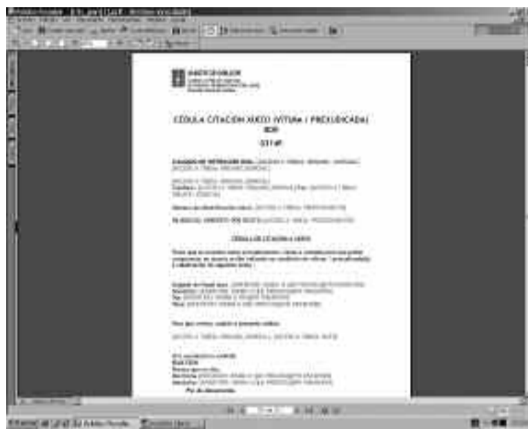
Modelo de documento en galego do programa de tramitación procesual Libra (caderno de documentos da xurisdición penal).

Para levar adiante todo este proceso de normalización lingüística na Administración de xustiza, é necesaria a colaboración das dúas consellarías que teñen competencias nestas materias: Educación, como responsable do labor de política lingüística, e Xustiza, que xestiona a Administración xudicial.